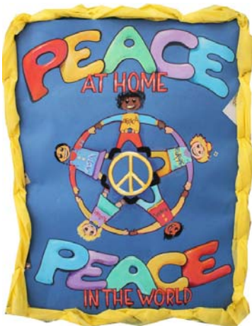
Yağız Aral 6A